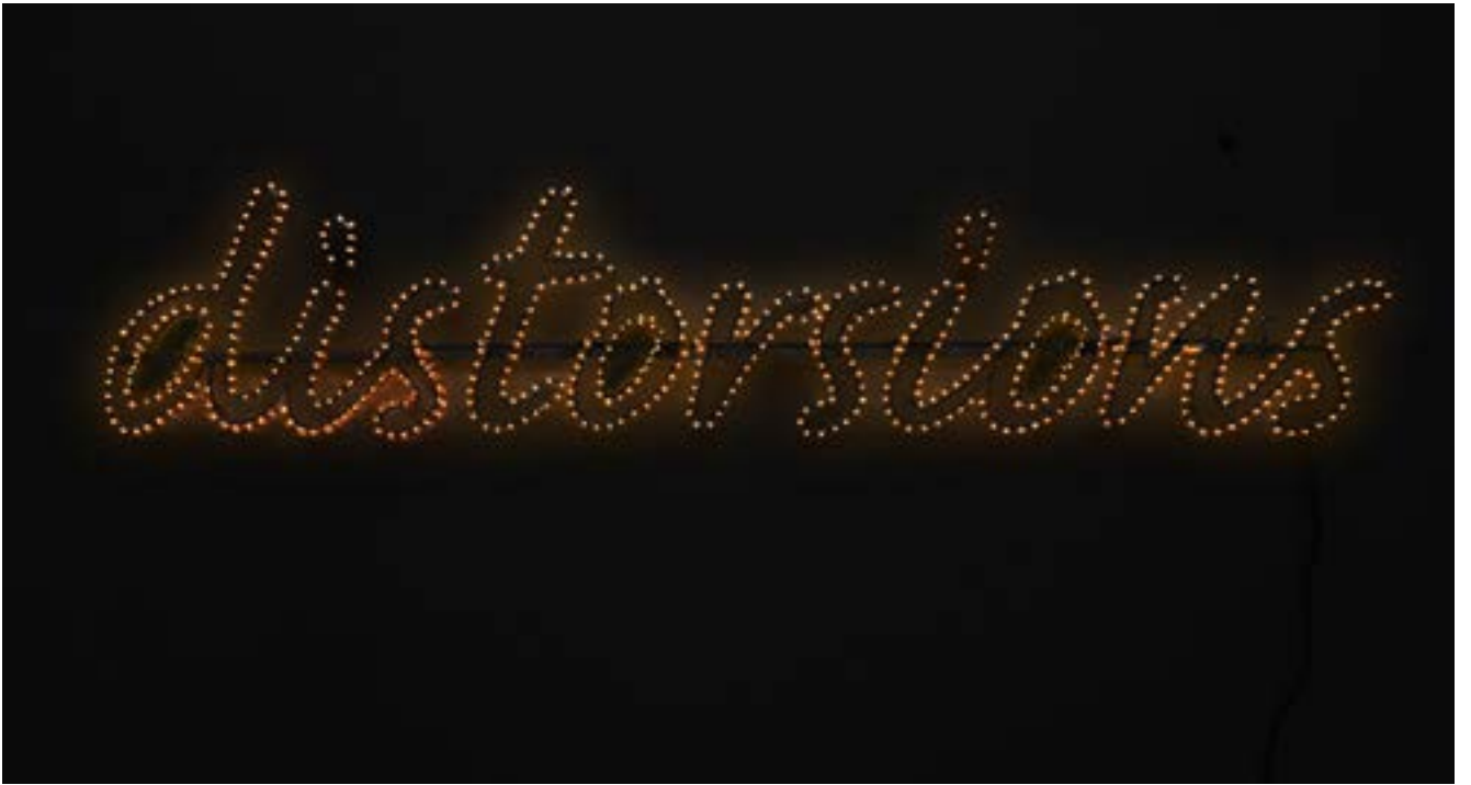
Distorsions — 2015 Aluminium structure, Led 54x240 cm