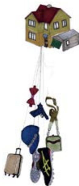
Flying house — 2013 Série de dessins Encre sur papier 42,2x29,7 cm chaque