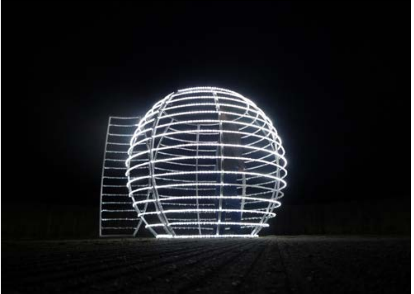
Light house III— 2013 Aluminium, LED 1m80 x 2m

Monumentale cage de lumière, Light house symbolise un lieu intime, où l'on se tient soi-même en otage.