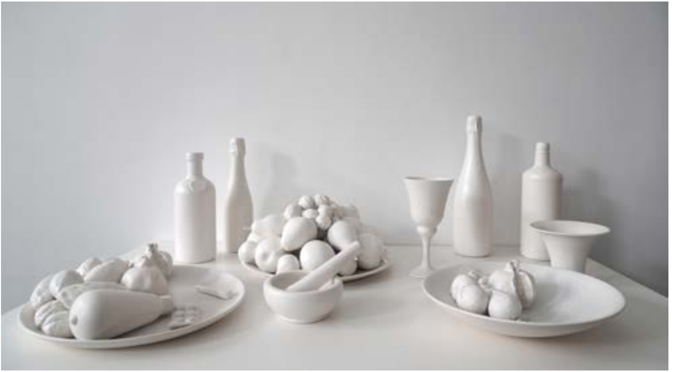
Nature morte — 2015-2016 céramique dimensions variables