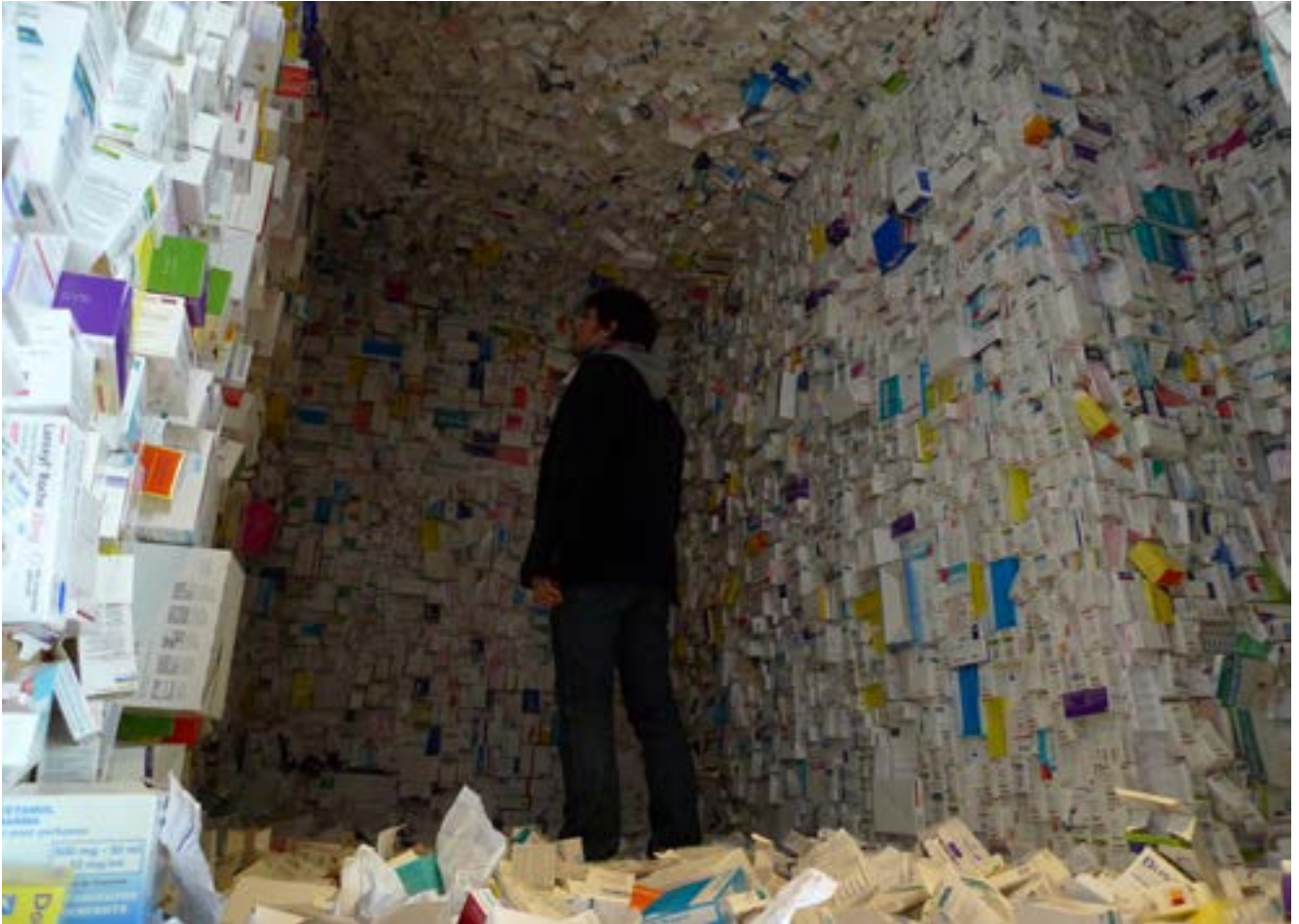
La Maison malade — 1999-2010 Installation Boîtes de médicaments. Dimensions variables.

La Maison malade est un espace clos, saturé de boîtes de médicaments. Une invraisemblable pharmacie livrée au chaos, débordant d'emballages, empilés, entassés du sol au plafond. Le spectateur indécis est obligé de se frayer un chemin en les piétinant. Chaque boîte raconte une histoire et nous renvoie à notre propre expérience. Une salle capitonnée et claustrophobique à l'image d'une société occidentale malade de sa surproduction, rassasiée au point de s'étouffer de médicaments et autres prescriptions. Contre des affections dont on ne sait plus très bien si elle résultent véritablement d'un malaise, s'auto-produisent dans un délire hypocondriaque, ou découlent de la consommation outrée de substances chimiques. Ou tout à la fois...