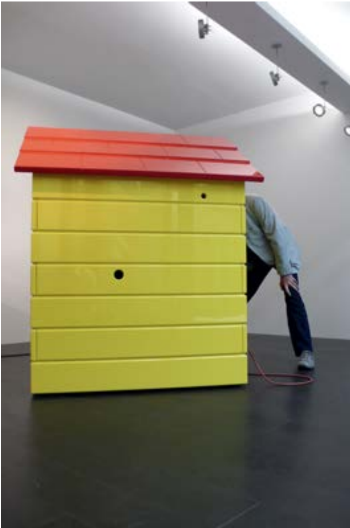
Peeping Tom's house — 2007 160x140x140 cm Bois, 10 écrans lcd et media players Son : Eric Pajot

Si d'ordinaire un des enjeux majeurs de la maison de poupées est de permettre à l'enfant de se constituer un univers propre dont il serait le maître exclusif, celui de la maison Peeping Tom's house témoigne d'un voyeurisme doux. Structure essentiellement ouverte, la maison de poupées joue ici d'une ambiguïté troublante en nous plaçant dans la position de l'intrus curieux. On découvre ici, à travers une dizaine de vignettes vidéo, un microcosme intime fait de multiples gestes d'hygiène « quotidienne », comiques ou étranges au mieux, absurdes ou inquiétants au pire, provoquant l'inconfort. Au fond c'est la nature aliénante des tendances de l'hygiène contemporaine qui est visée ici : leur propension à l'ubiquité, leur multiplication tant dans leur répétition que dans leur extension, témoignent des désirs névrotiques, conscients ou pas, de contrôle tout-puissant du corps.