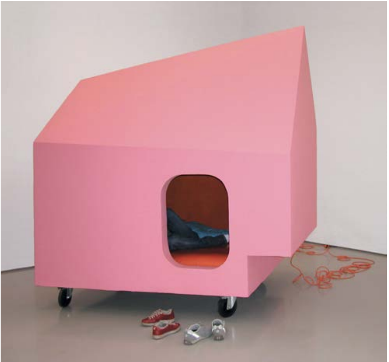
Pink house — 2002 Installation Mixed media, video screen 246 x 238 x 151 cm Vue du Musée d'Art Moderne, St Etienne

The Pink house a été créée après un séjour au Japon. C'est une cabane à roulettes qui évoque une maison de poupée. Mais son aspect séduisant et rassurant cache certaines particularités que le visiteur découvre en y entrant. L'intérieur est confortable mais ce qui est présenté à l'intérieur crée un malaise. L'apparence attrayante peut rapidement provoquer un sentiment de solitude ou de claustrophobie.