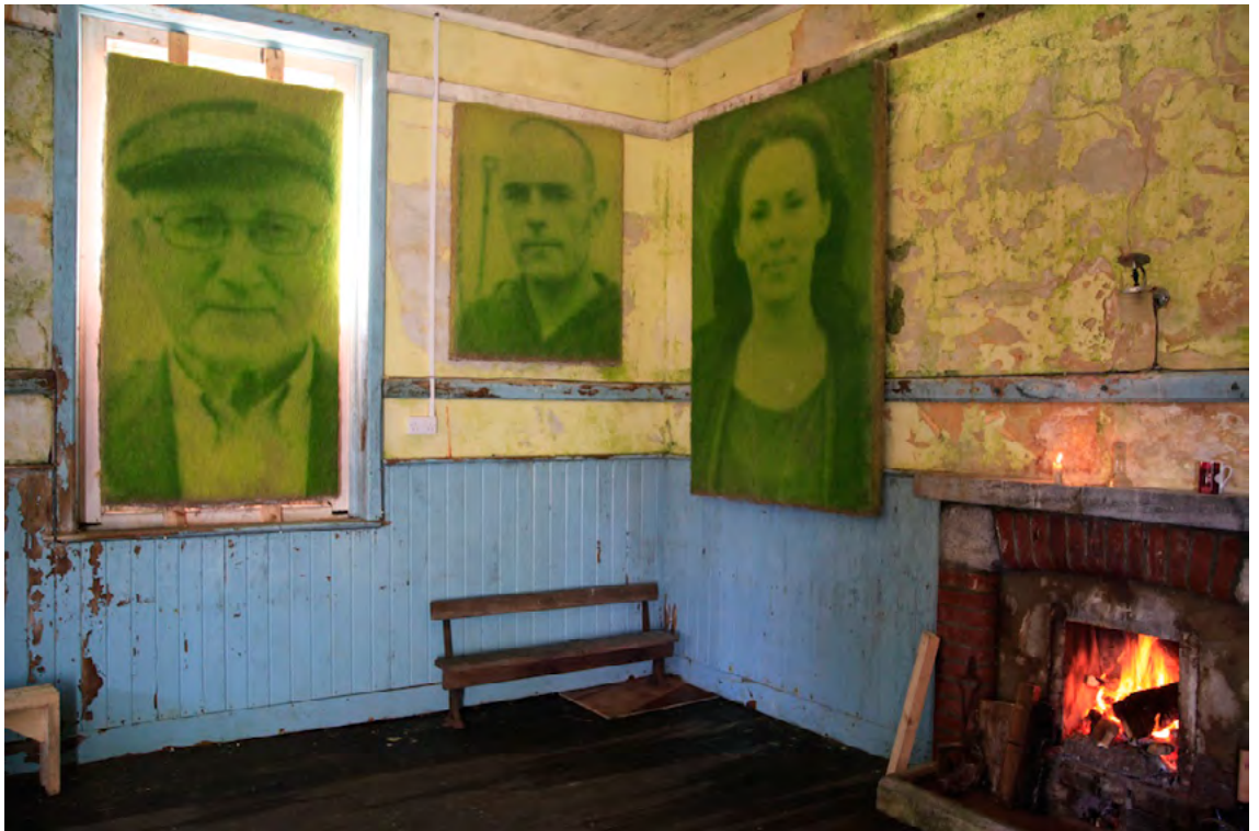
Inis Bearacháin , 2012 Semis, glaise, eau, lumière Festival de Tulca, Pays de Galle.