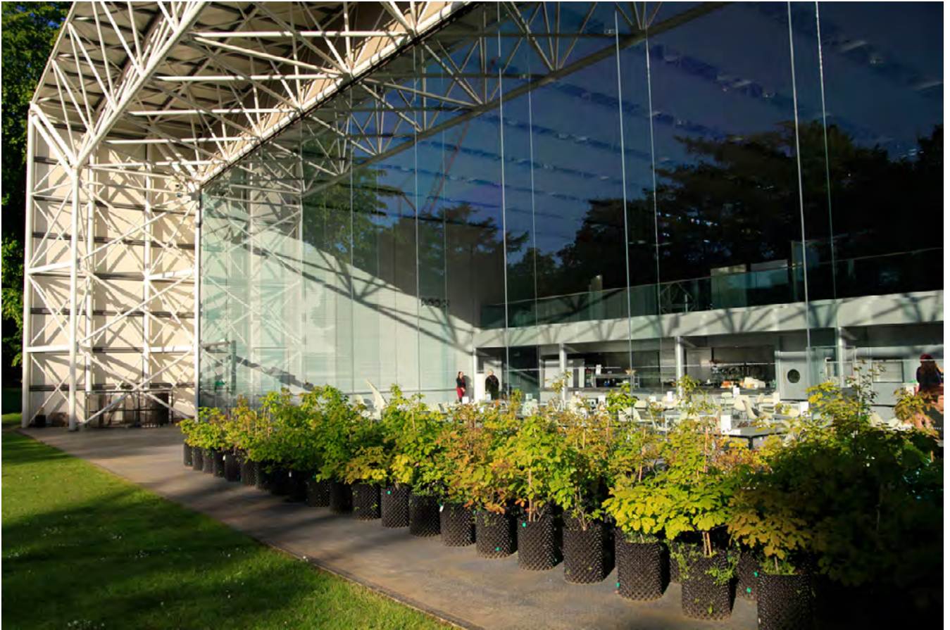
Beuys' Acorns/les glands de Beuys, 2007 – aujourd'hui Jeunes chênes en pot. Vue de l'exposition au Sainsbury Centre for Visual Arts en 2013