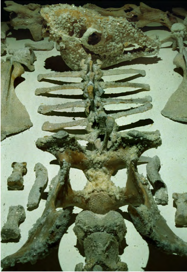
89-91 Lake Street, 1994 Squelette de chameau, cristaux de sel. Festival d'art de Perth, W. Australia.