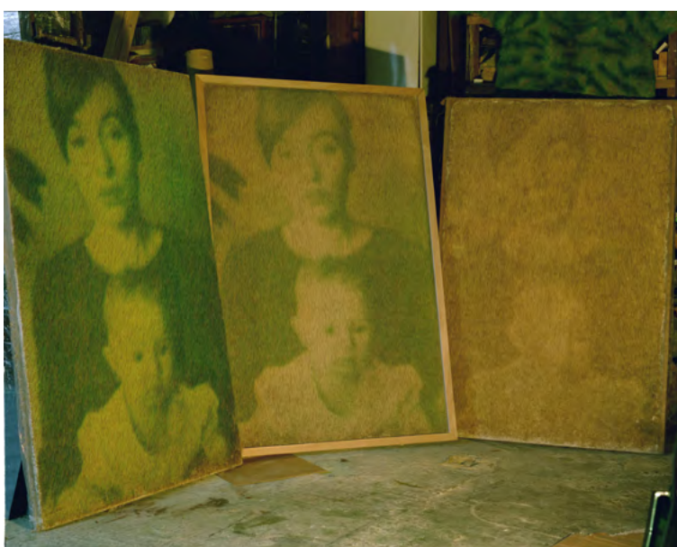
Presence, 1998-2012 Photographies photosynthétiques. Résidence et exposition au Isabella Stewart Gardner Museum, Boston