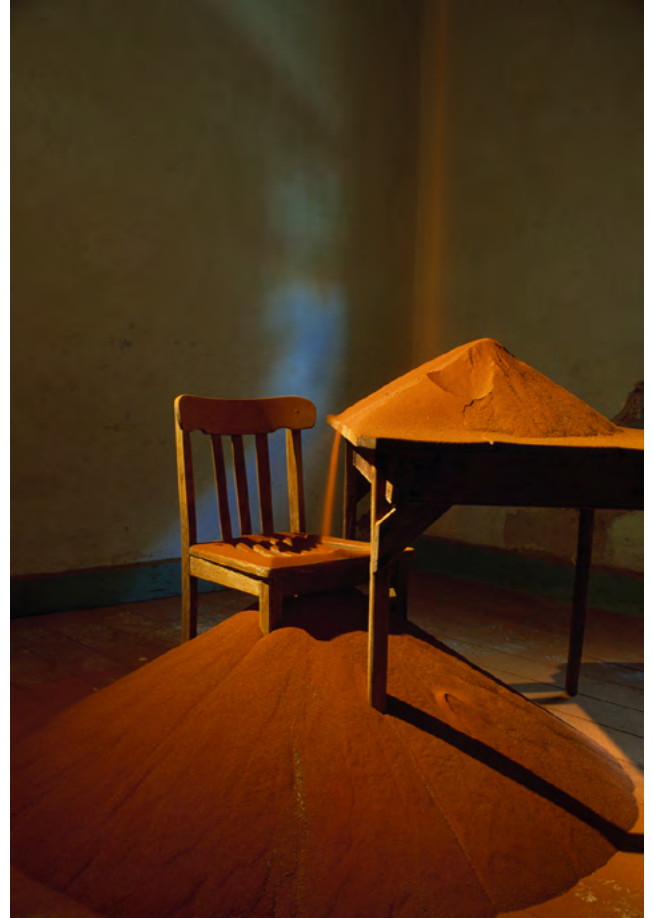
89-91 Lake Street, 1994 Sable. Festival d'art de Perth, Australie. Crédit photo : Ackroyd & Harvey